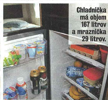
Chladnička má objem 167 litrov a mraznička 29 litrov.