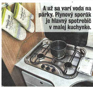
A už sa varí voda na párky. Plynový sporák je hlavný spotrebič v malej kuchynke.