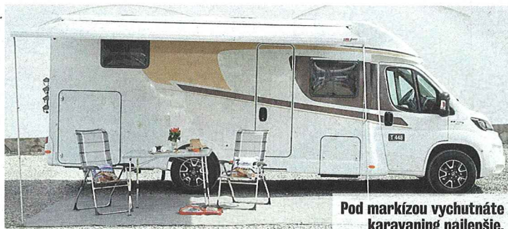
Pod markízou vychutnáte karavaniung najlepšie.

Ideme na východ, smer Domaša. Rýchlo zisťujeme, že ideálna rýchlosť po diaľnici je 100 km/h. V karavane chceme vychutnávať cestu a výhľad. Keď dostaneme chuť na kávu, tak sa zastavíme a uvaríme si ju. Aróma čerstvej kávy zaplaví